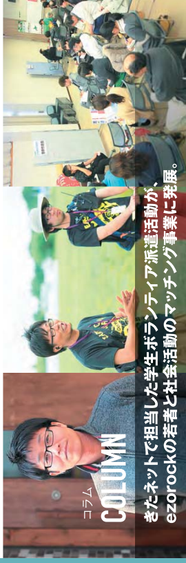
コラム きたネットが担当した学生ボランティア派遣活動が、ezorockの若者と社会活動のマッチング事業に発展。

環境中間支援会議、北海道/環境省北海道環境パートナーシップオフィス、公益財団法人北海道環境財団、札幌市環境プラザ(指定管理者) 公益財団法人さっぽろ青少年女性活動協会、NPO法人北海道市民環境ネットワーク